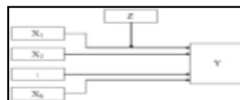
Gambar 1. Model Regresi Variabel Moderasi Lebih dari Satu Variabel Independen

Menurut Suliyanto (2011), variabel moderasi adalah variabel yang mampu mempererat atau memperlemah hubungan antara variabel independen terhadap variabel dependen. Variabel moderasi bisa berbentuk kualitatif (kode, kategori) atau kuantitatif (skor) yang mempengaruhi hubungan antar variabel dependen dan independen. Pada konsep korelasi, variabel moderasi adalah variabel ketiga yang mempengaruhi korelasi dua variabel. Untuk menggambarkan model hubungan moderasi yang lebih dari satu variabel independen dapat dilihat pada Gambar 1.